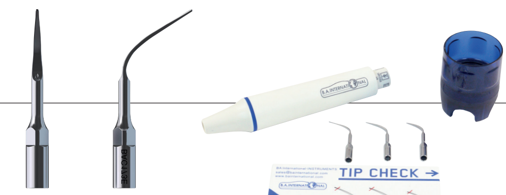
B.A. ZEG Spitzen