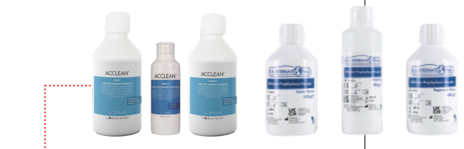
B.A. & HS-Acclean Prophylaxe-Pulver