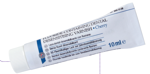
HS-Fluoridhaltiger Lack für Kinder

TIPP unter 18 Jahren wird die PZR bei Kindern von den Krankenkassen übernommen