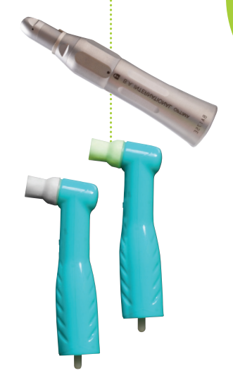
B.A. gerades Handstück

TIPP Bitte beachten Sie die Arbeitszeiten in der Anleitung